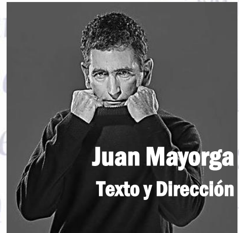
Juan Mayorga Texto y Dirección

Juan Mayorga nació en Madrid en 1965. En 1988 se licenció en Filosofía y en Matemáticas. Amplió estudios en Münster, Berlín y París. En 1997 se doctoró en Filosofía. Ha enseñado Matemáticas en Madrid y Alcalá de Henares. Es profesor de Dramaturgia y de Filosofía en la Real Escuela Superior de Arte Dramático de Madrid. Dirige el seminario "Memoria y pensamiento en el teatro contemporáneo" en el Instituto de Filosofía del CSIC. Su trabajo filosófico más importante es "Revolución conservadora y conservación revolucionaria. Política y memoria en Walter Benjamin". Entre otros premios, ha obtenido el Nacional de Teatro (2007), el Valle-Inclán (2009), el Max al mejor autor (2006, 2008 y 2009), el Max a la mejor adaptación (2008) y el Nacional de Literatura Dramática (2013). En 2018 ha sido nombrado miembro de la Real Academia Española.